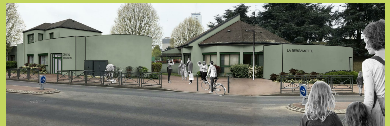
VUE DU CENTRE MUNICIPAL «LA COLLINE»

“Mon projet de réaménagement de la ville concerne tous les quartiers. Aucun ne sera oublié !”